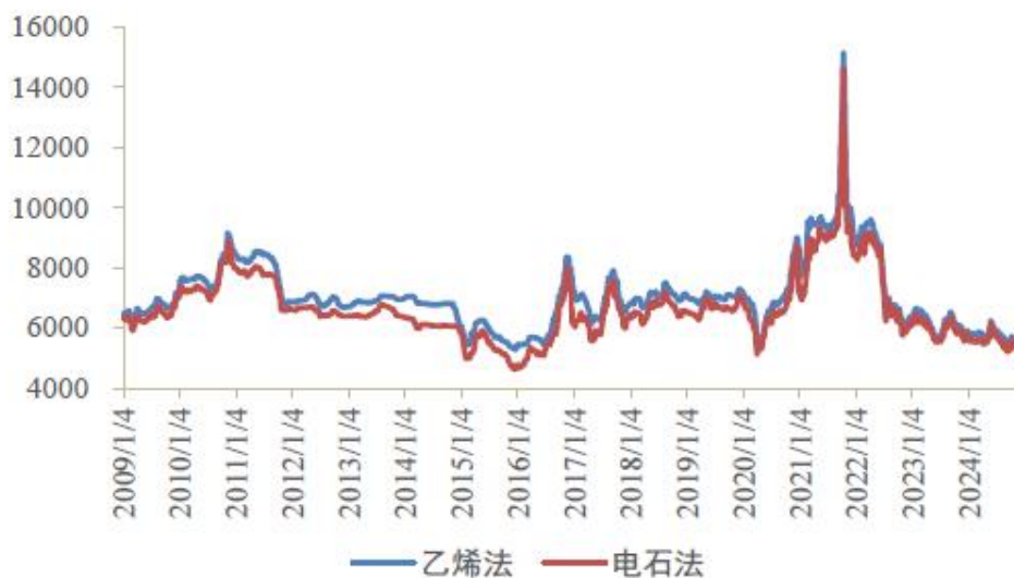
2009-2024 年我国 PVC 市场走势（单位：元/吨）

展望 2025 年，PVC 规划新增产能约 180 万吨，多数为乙烯法装置，同时非一体化、无成本优势的落后产能仍然面临淘汰退出；需求端预计呈现增速缓慢趋势，未来国内 PVC 消费结构随着房地产市场供应结构的变化而调整，传统管型材市场步入平缓期，而新型建材、包装、医疗、线缆等产业需求仍有望迎来增长。